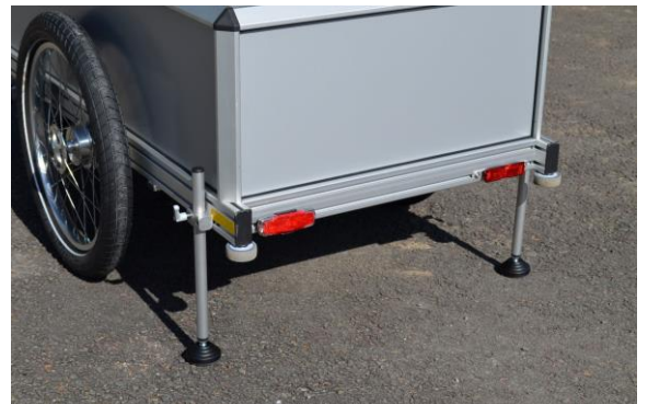
Zusätzliche Stützen am ROBERT XL, mittig oder beidseitig