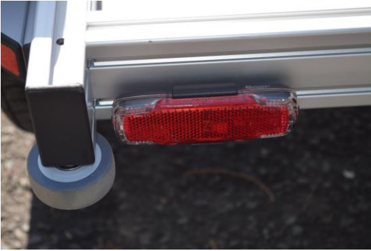
Rücklicht Busch und Müller Toplight 2C serienmäßig