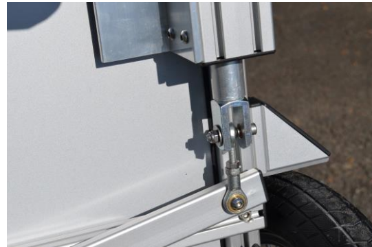
Anlenkung der Bremsmechanik mit wartungsfreien Gelenkköpfen