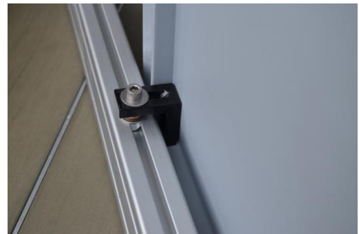
Befestigung von Eurokisten mit Winkeln