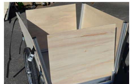
ROBERT L mit Ladewänden. Die Wände werden ohne Schrauben befestigt und sind schnell demontierbar.